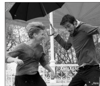
Les Tit'Nassels (variété française).

PRATIQUE. Tarif : 12 €. Salle des fêtes de Mervans. Réservation : 03.85.76.11.70.