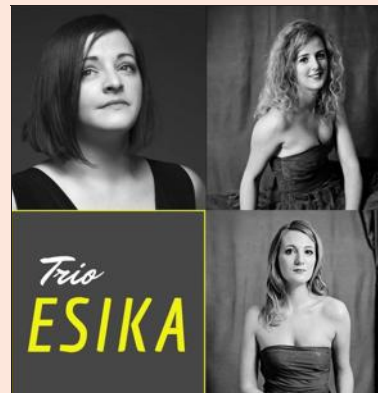
Le trio Esika.

Le festival des Automnales du château de Pierre-de-Bresse vous offre une balade dans le temps et les genres musicaux, tous les dimanches d'octobre et de novembre. Dimanche 20 octobre, le trio Esika (violin, chant, piano), qui s'empare aussi bien d'œuvres d'auteurs contemporains, que classiques ou romantiques, se produira dès 15 h 30.