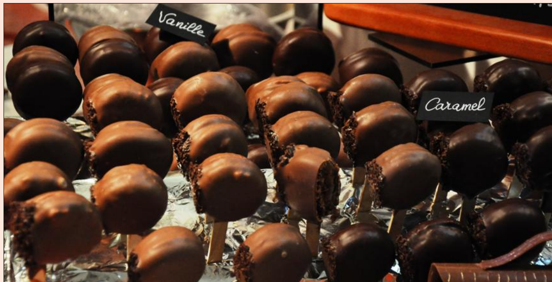
Il y en aura pour tous les goûts et pour tous les gourmands, ce week-end, au Palace de Louhans.

PRATIQUE. Palace Pierre Provence à Louhans. Tarif : 3 €. Gratuit pour les enfants de moins de 12 ans.