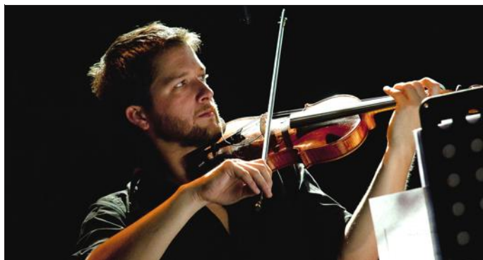
Clément Janinet sera en concert au Lion d'Or ce samedi.