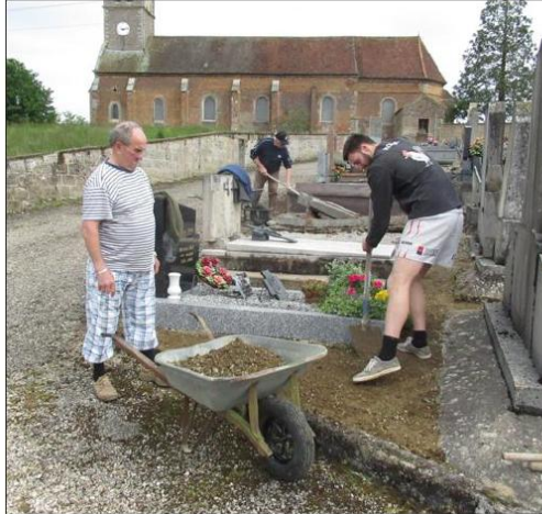
Un gros travail a été réalisé par les bénévoles pour la rénovation des allées du cimetière.

Au total, ce sont 70 personnes qui se sont dispersées toute la journée de dimanche aux quatre coins du bourg, pour réaliser tous ces travaux dans la bonne humeur et une belle convivialité. L'un des gros