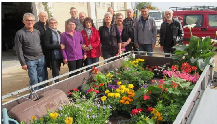
Au départ de l'action fleurissement des membres du conseil municipal.