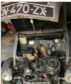
Réparation de la 2CV chez un ami près de Freiburg.