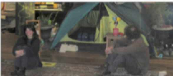
Une tente de tente bien utile en voyage.