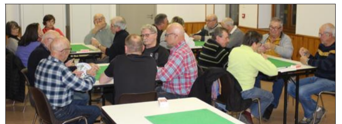
Soirée calme et sympathique pour la soirée jeux de société à Jovençon

Comme tous les quinze jours, de septembre à mi-avril, une petite vingtaine de joueurs plus ou moins amateurs, se réunissent le mercredi soir pour la traditionnelle soirée jeux de société à la salle des associations.