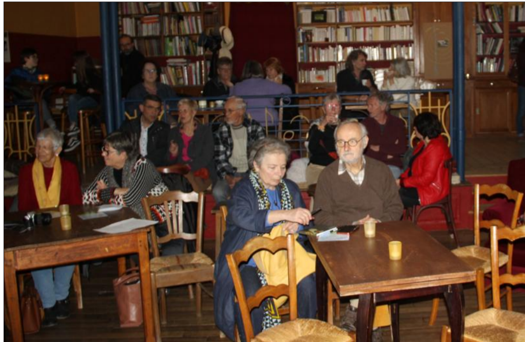
L'assemblée générale de l'association du Lion d'Or s'est tenue dans la salle de bal.

adhérents, souhaite mettre en place une gestion par un conseil collégial d'administration. Une assemblée générale extraordinaire est prévue à cet effet le 24 mars.